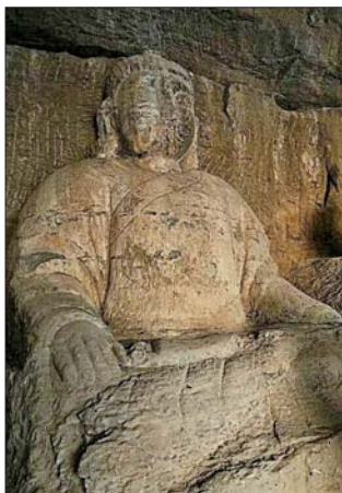
西石壁唐代摩崖雕像。

边石壁上，有一尊面东而坐的摩崖石雕造像，这尊石像高约1.4米，宽约1.5米，长耳阔垂，神态自然，造型饱满，双手抚膝，衣饰简单。从风格上判断应是一尊唐代刻凿的释迦牟尼雕像。之所以在这个隘口雕凿这尊石像，估计是希望佛祖保佑路人的平安。由于年代久远的原因，石像面部的五官已有些模糊。