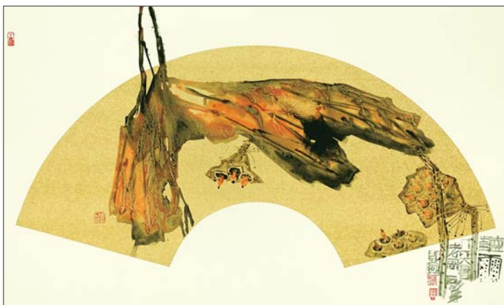
▲扇面 听雨 周石峰