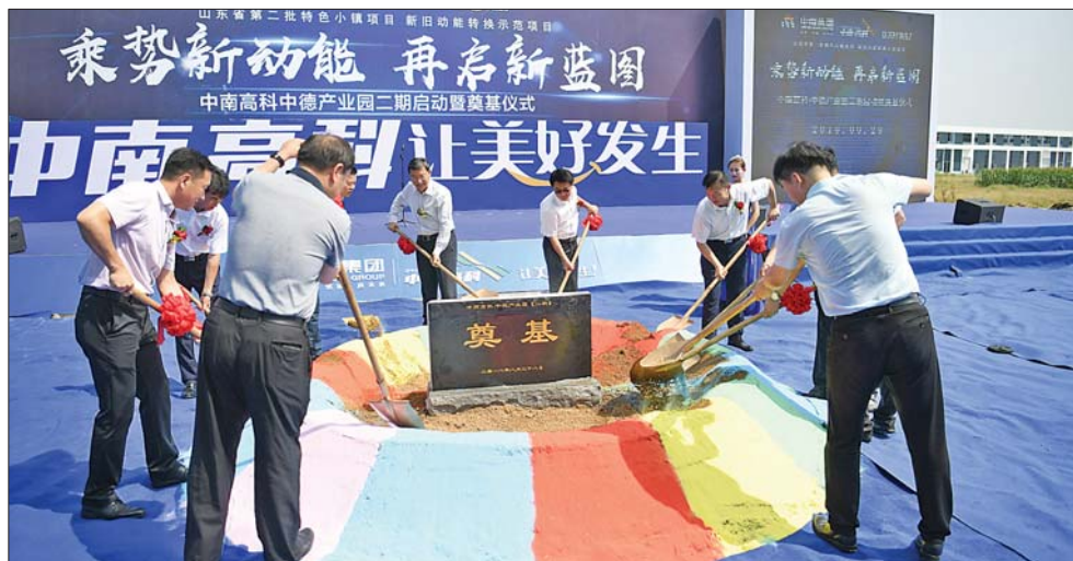
中南高科·中德产业园二期正式奠基启动。

除外资企业与外地企业外,园区还汇集了济南本土的优质企业,形成“山东制造、济南制造”的标杆企业集群。其中,山东慧敏科技是集新型材料技术研究、开发、生产、推广于一体的高新技术企业;山东省鑫博安智能设备致力于铁路自动化控制系统、铁路机车车辆配套设备及其测试装备、铁路专用智能工具的研究、开发和生产;盖特航空科技专注于航空技术研究与应用、机载设备制造与服务,电子自控系统装配,航空航天器械研发设计,