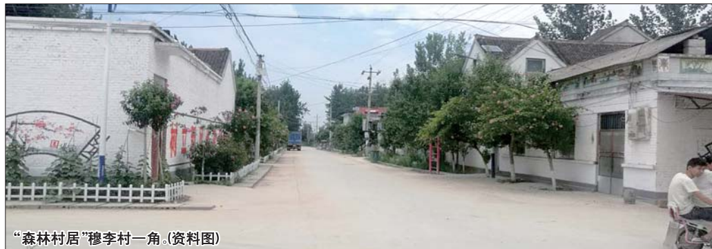
“森林村居”穆李村一角。(资料图)