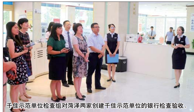
千佳示范单位检查组对菏泽两家创建千佳示范单位的银行检查验收。