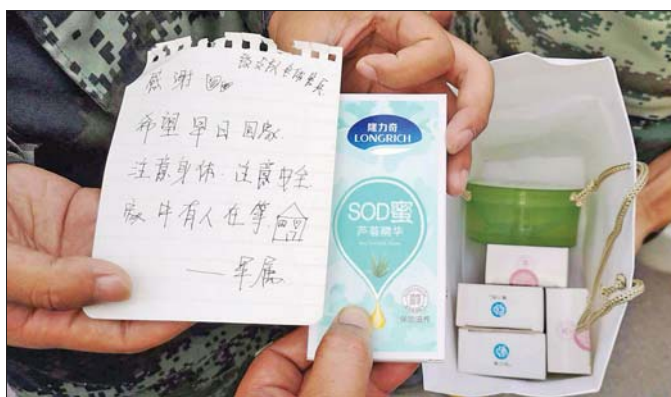
这就是消防官兵收到的防护品。

最后,聊城消防支队的官兵还是想到了一个办法:二维码付款。他们回到女店主那里,悄悄地将微信支付