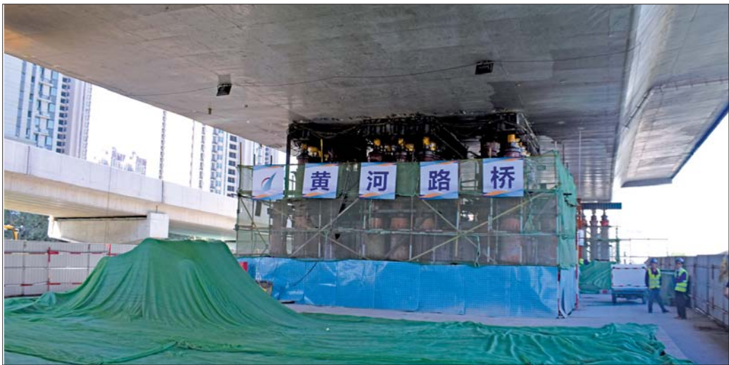
123台千斤顶顶起了7500吨箱梁。

经过25天的施工，北园高架西延顶升工程近日结束。4日记者探访获悉，桥梁顶升最高处4.2米，创造了济南工程顶升高度的纪录。顶升完成后，新建高架和顶升段将于10月份“合龙”。按照工程进度，北园高架西延工程高架段明年元旦通车。