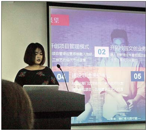
春泥造物项目获得一等奖。