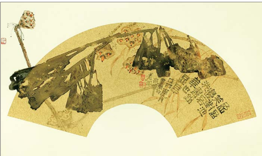
▲盈盈笑对 扇面 2018年