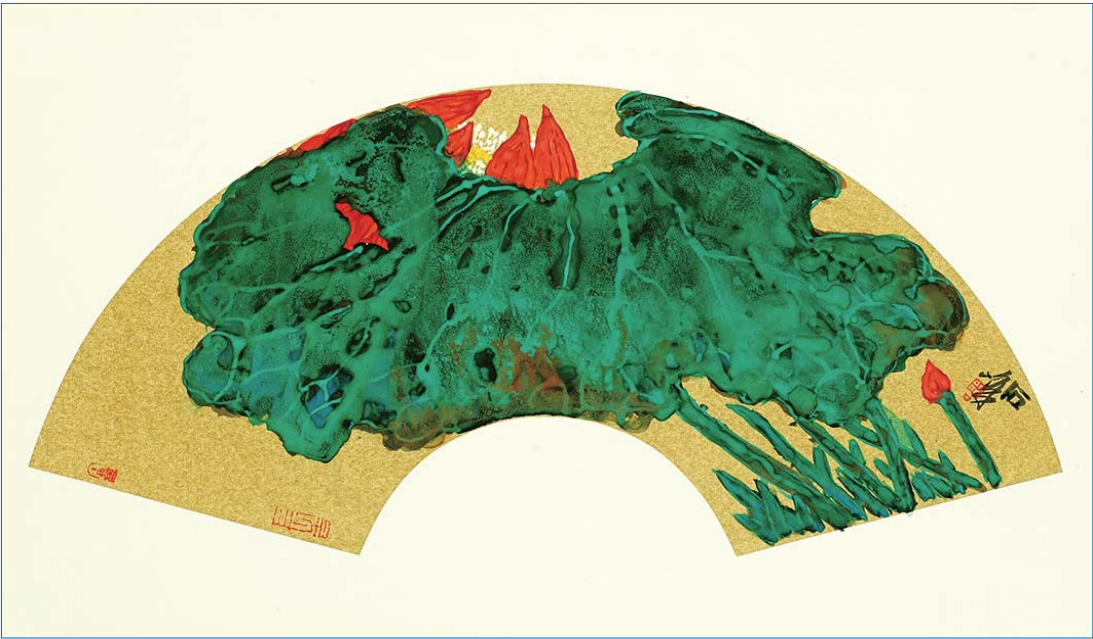
▲晚照 扇面 2018年

曾获中国文化部主办的第二届全国画院双年展学术奖、第四届全国画院优秀作品展画院奖。中国美术家协会主办的全国首届中国山水画展优秀作品奖、首届中国写意画展优秀作品奖、第二届全国中国画展银奖。入选第十一届全国美展。