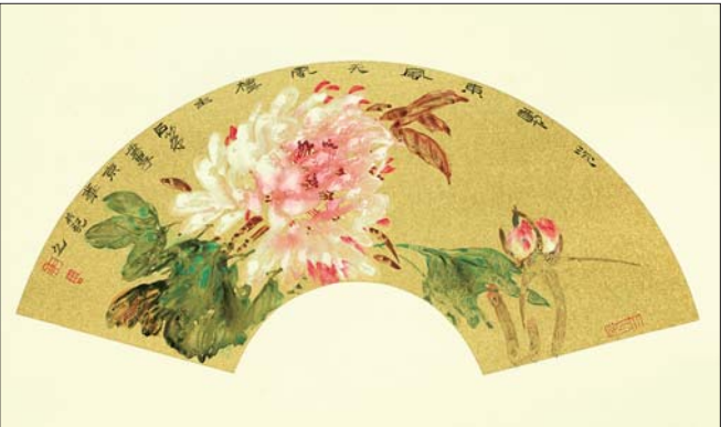
▲沉醉东风 扇面 2018年