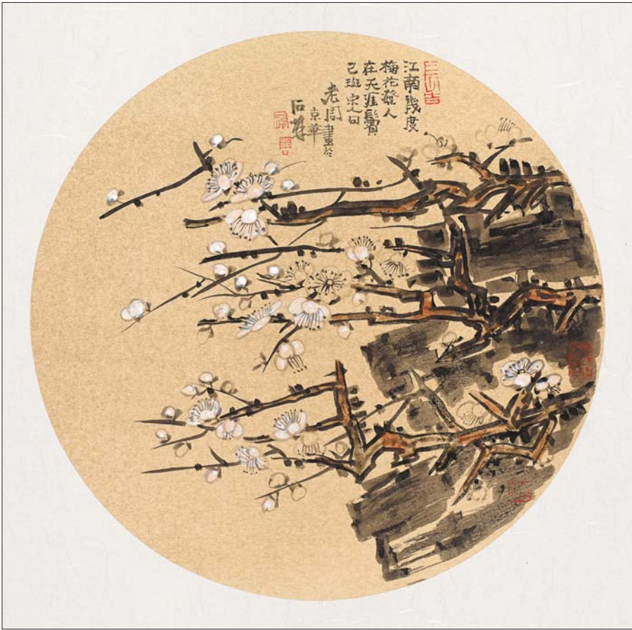
▲江南几度梅花发 2018年