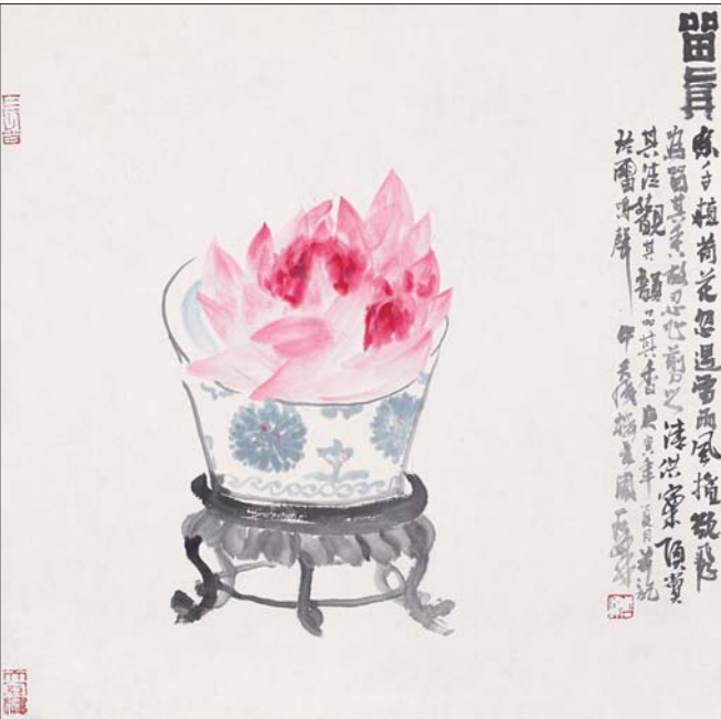
▲留真 50x50cm 2010年