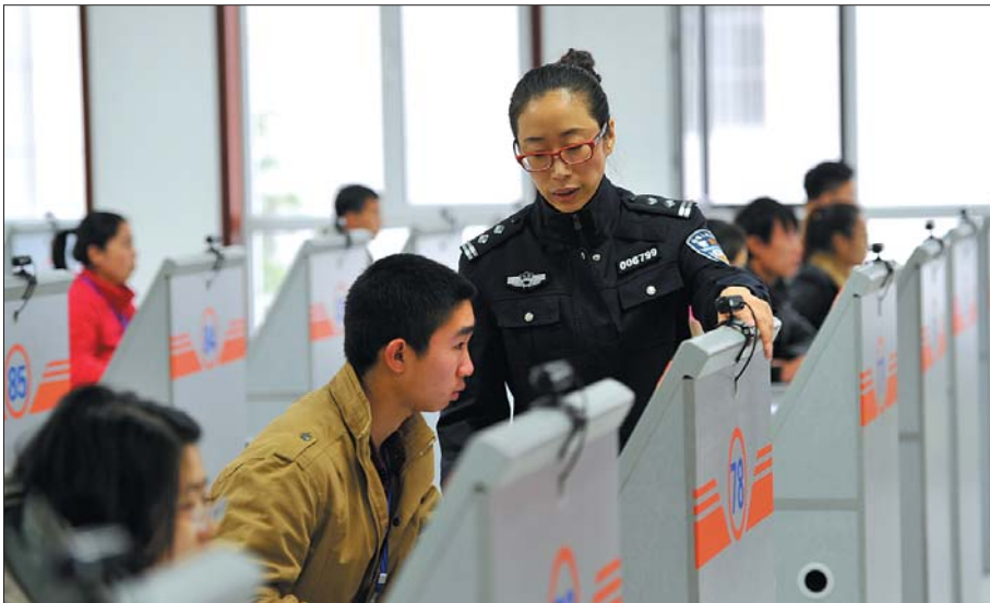
驾考科目一考试。(资料片)

“口袋”驾驶人注意,你的驾驶证可能已经逾期未换证面临注销。11日,记者从济南市车管所了解到,截至目前,全市今年已有3000多名驾驶人逾期未换证,其中400余人因为逾期超过一年被注销驾驶资格,需要重考科目一才能恢复。