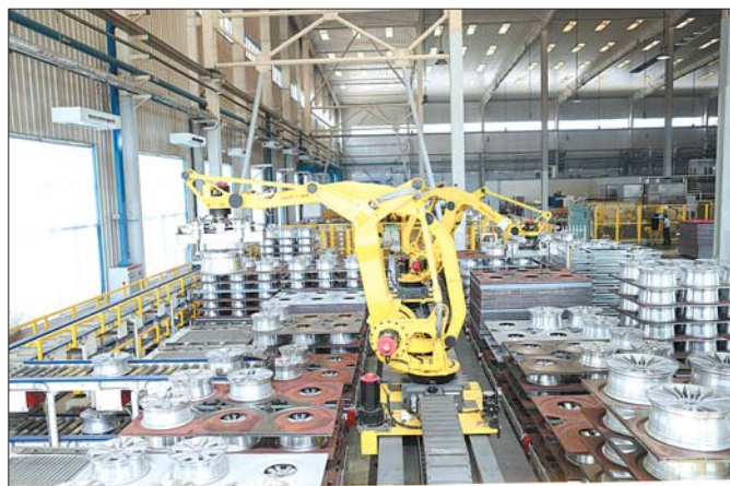
盟威戴卡智能制造升级改造项目，轻量化、智能化水平世界领先

同时，以“放管服”改革为抓手，推进体制机制改革，优化服务环境，年内建成开发区政务服务中心，将发改、经信、人社、工商、税务、不动产等所有审批事项全部纳入“一网通