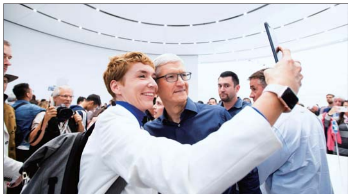
9月12日,在美国加利福尼亚州丘珀蒂诺市,苹果公司首席执行官蒂姆·库克(右)和一名记者自拍合影。