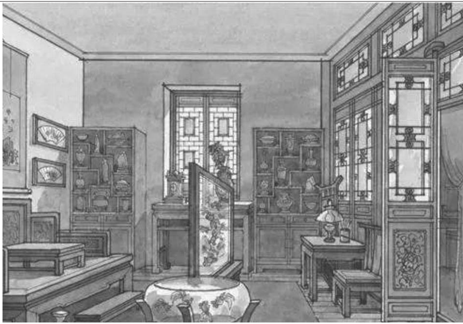
《霸王别姬》程蝶衣家气氛图