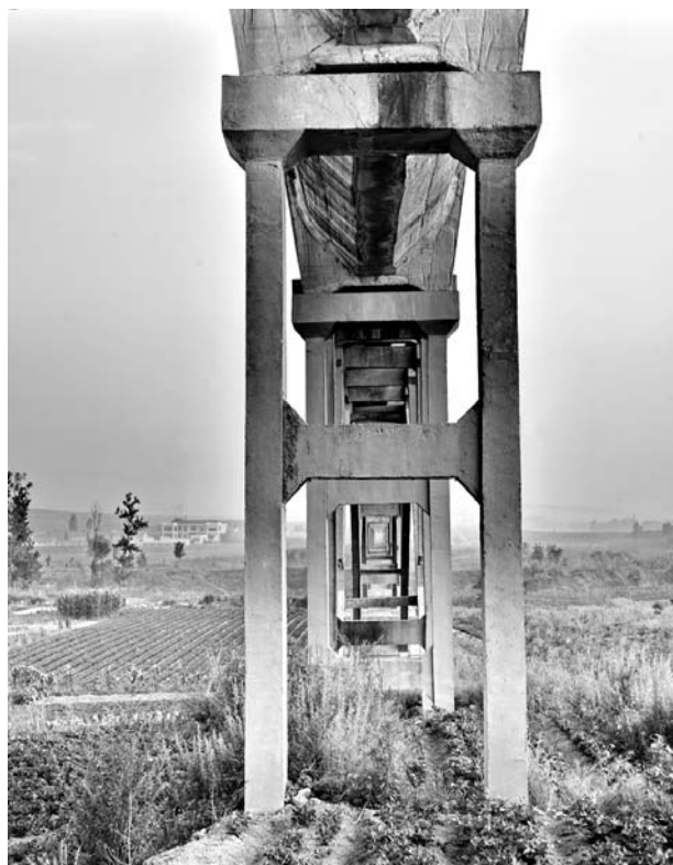
立地顶天, 风骨仍见(东上千渡槽)