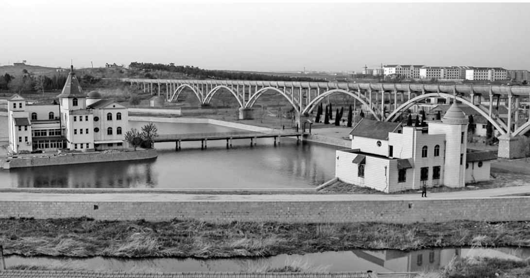
老槽新房相映托, 继往开来看乳山(东耿家渡槽)