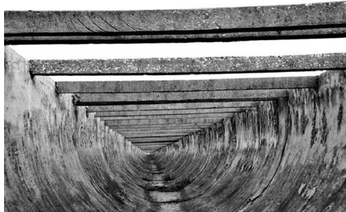
忆昔泛波东流水, 滋润一方水土人(东上千渡槽)