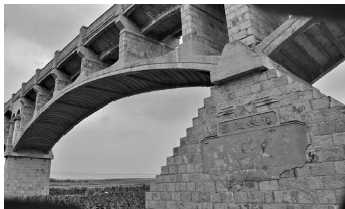
一凿一锤石方正, 抹缝严整见人工(曲水渡槽)