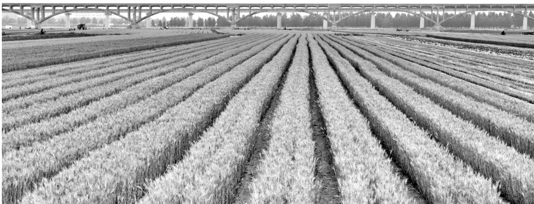
风吹麦浪仍壮色, 别忘红旗渡槽水(红旗渡槽)