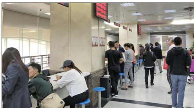
房产交易大厅内办理业务的市民络绎不绝。

外地户籍在济工作的全日制本科大学生在济南购房,提交资料申请限购核查时,不用再提交用工合同,社保缴纳情