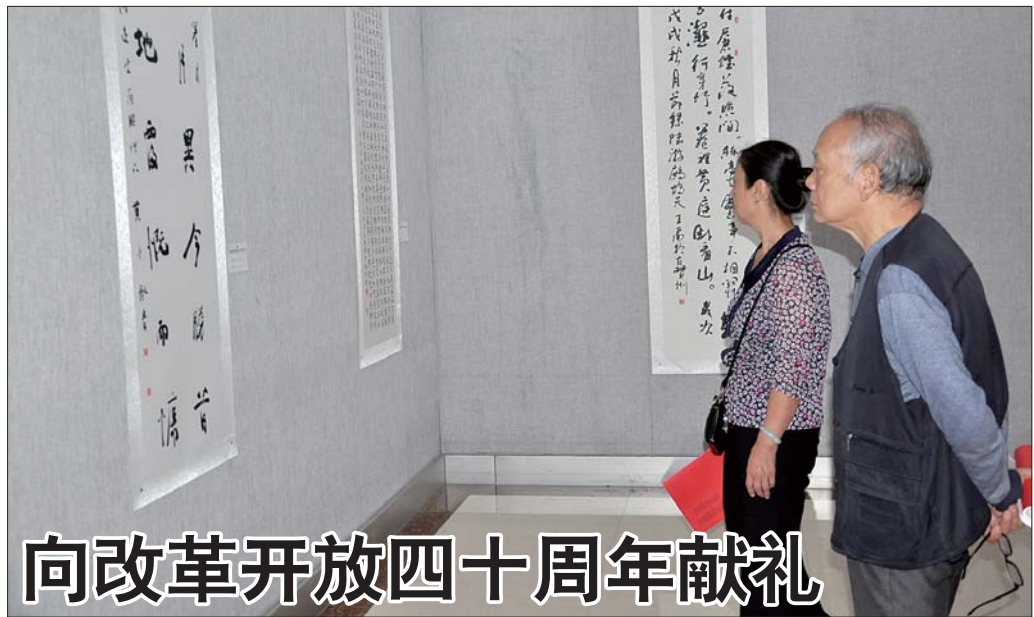
向改革开放四十周年献礼 20日,菏泽市纪念改革开放四十周年书画作品展在菏泽市博物馆举行,集中展示了菏泽书画作者近期创作的120余幅作品,展出作品既立足当下又根植传统,既主题鲜明又风格多样,从多个角度和层面展现了人民群众昂扬向上的精神风貌和经济社会发展的骄人业绩。所有作品以统一尺寸、统一装裱的书画形式,向改革开放四十周年献礼。

泽市污水处理厂污泥焚烧处置项目政府采购(特许经营)合同》。合同的签订,意味着未来25年内菏泽市区三个污水处理厂产生的污泥将全部由该公司进行焚烧处理。该项目的启动填补了菏泽市污泥焚烧处置项目的空白,既符合污泥处理行业规范,又符合环保部门的要求。