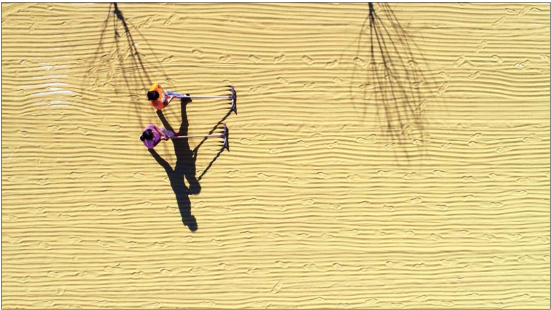
白露白茫茫,谷子满田黄。临沂市沂南县12000亩谷子进入成熟收获期,当地农民抓住晴好天气抢收,到处洋溢着丰收的喜悦。