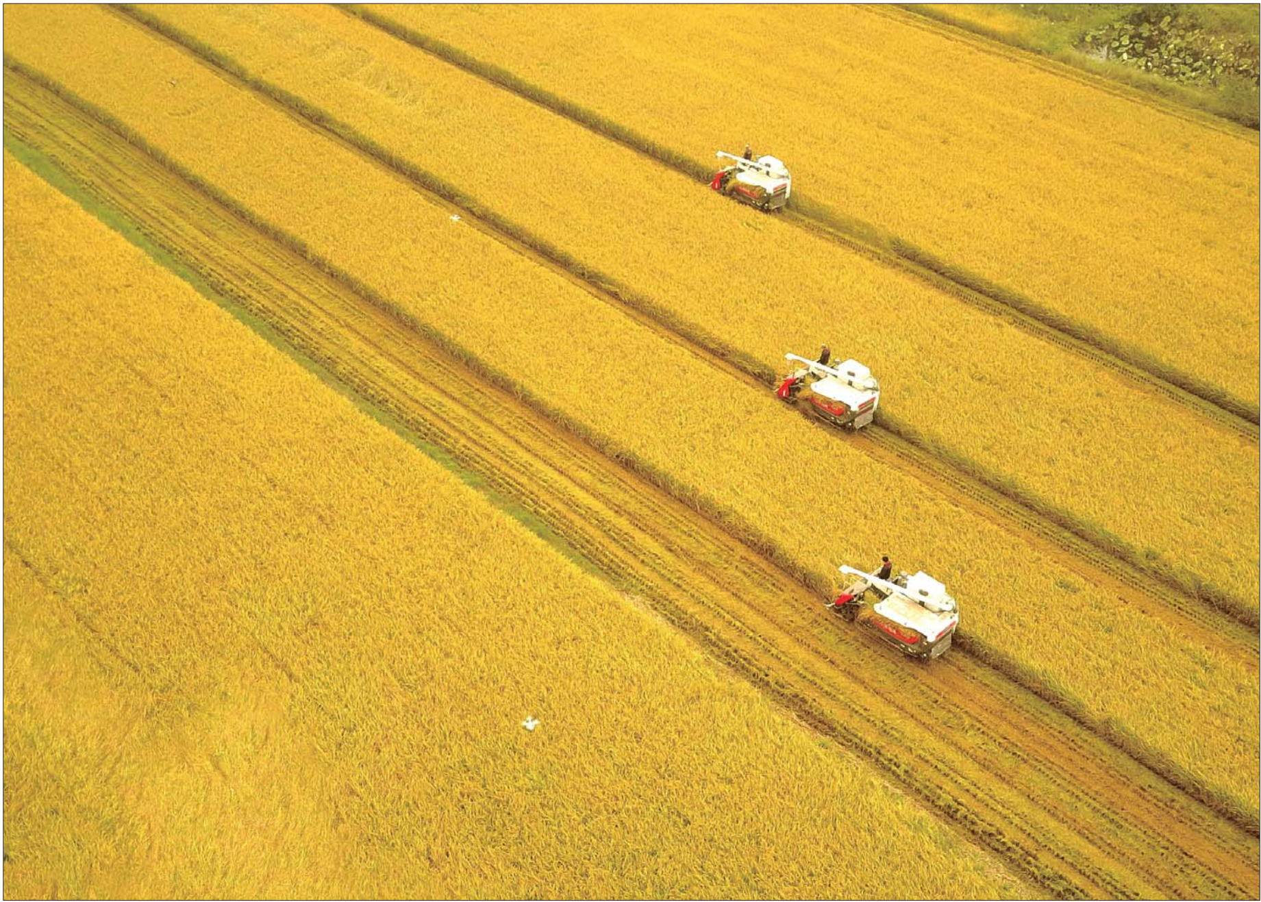
收割机游弋在金黄色的稻田里,留下了几条笔直的痕迹。9月20日,济南西郊的吴家堡办事处七里铺村,这里的首批稻田开始收割。