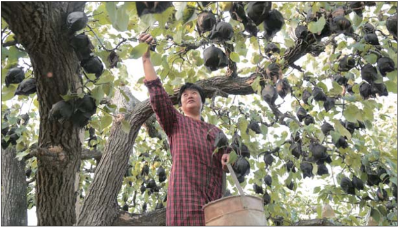
一名妇女在聊城冠州梨园摘梨,这棵梨树王每年结出四千斤果实,至今已有300多年树龄,是康熙年间种下的。