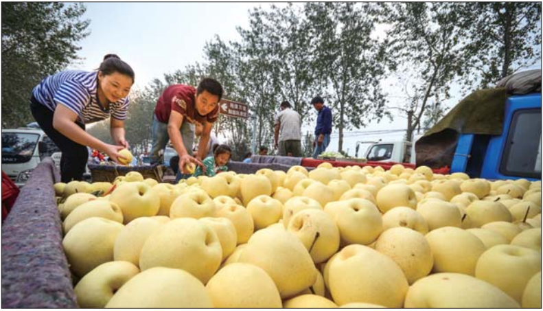
今年是阳信鸭梨的又一个丰收年,吸引众多外地客商来收购。阳信县是中国鸭梨之乡,年产优质鸭梨20万吨。