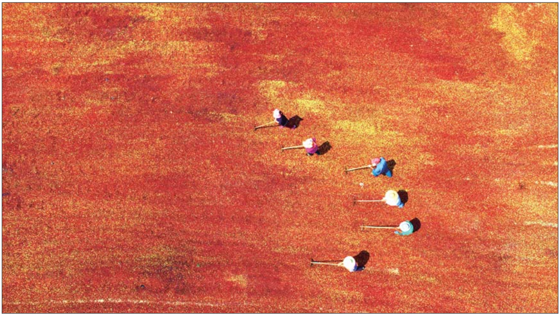
漫山遍野,层林尽染。在酸枣成熟的季节,沂蒙山区沂南县成了酸枣的海洋,人们晾晒酸枣的场景,犹如一幅浓墨重彩的油画。