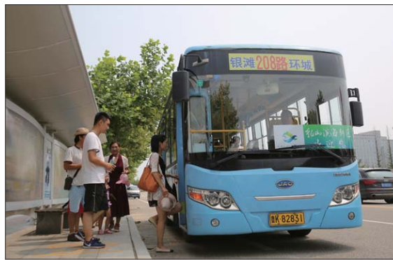
乳山滨海新区环城公交方便居民出行。

目前,由社区引导、业主自发成立的歌唱舞蹈、器乐演奏、书画研究、太极武术以及球类运动等文体组织约40余个,已成为社区组织的各类节庆演出、消夏晚会、广场舞等活动的绝对主力。