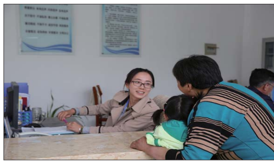
社区服务中心工作人员耐心为居民解答问题。