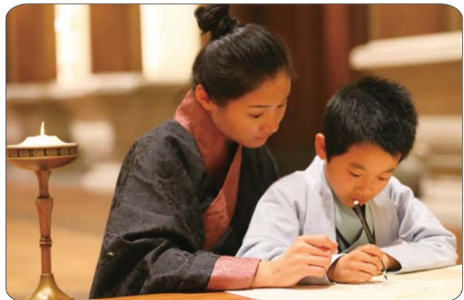
小学童手持毛笔，一笔一划临摹字帖。