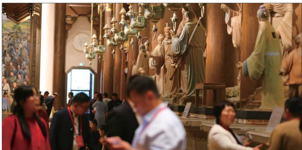
每一尊陶塑都出自儒家经典，形象栩栩如生。