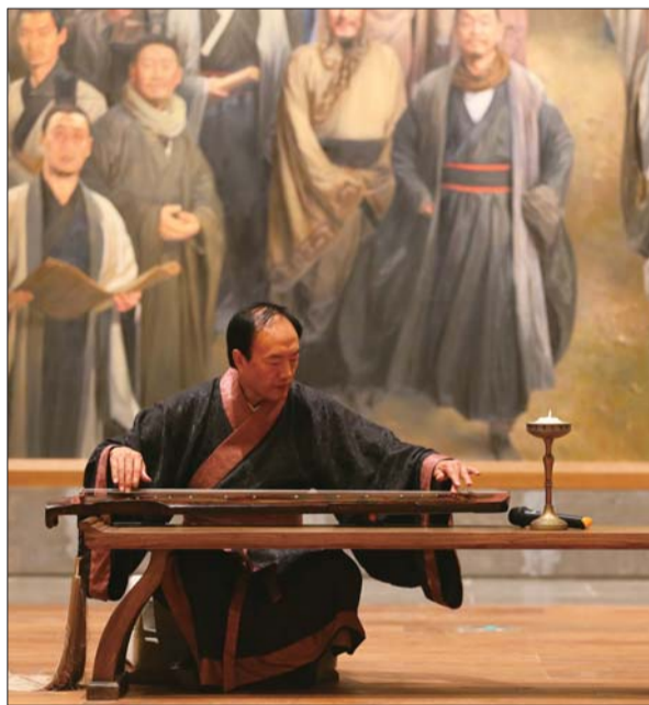
古琴声伴着点点烛光，仿佛将时空倒转回2600多年前。

启示”：“天人合一”的宇宙观，对解决今天人类面临的许多难题有十分重要的启示；“协和万邦”的治理观，印证了追求和平是中华民族精神的鲜明特色，启示人类命运共同体是世界各国携手前