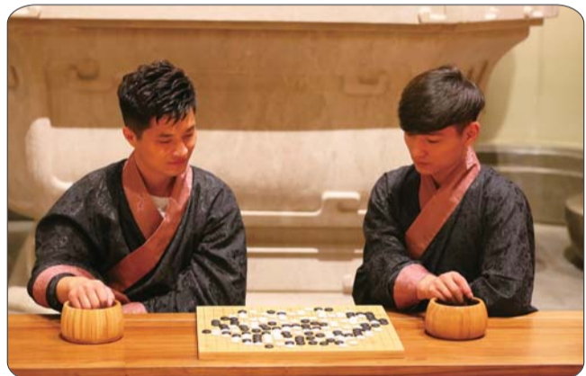
尼山圣境大学堂内，志愿者着古装向参会嘉宾展示古典棋艺。