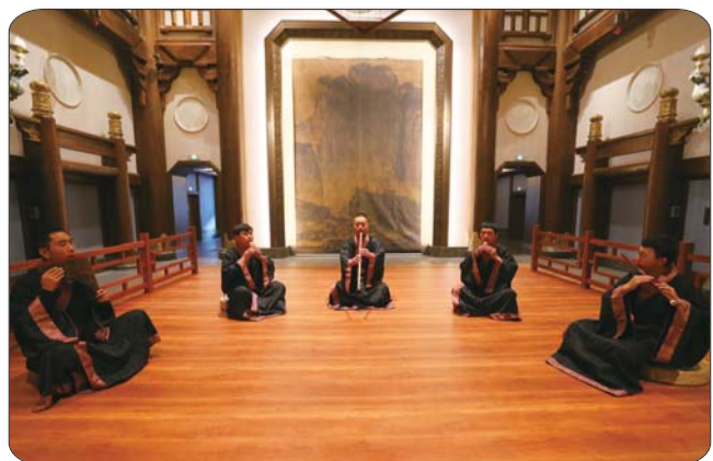
陶埙、笛箫吹奏出的悠悠乐声在尼山圣境大学堂内飘扬。