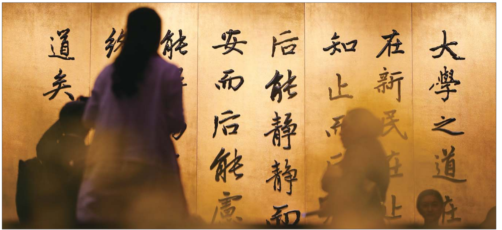
“大学之道，在明明德”，儒家经典跃然墙上。