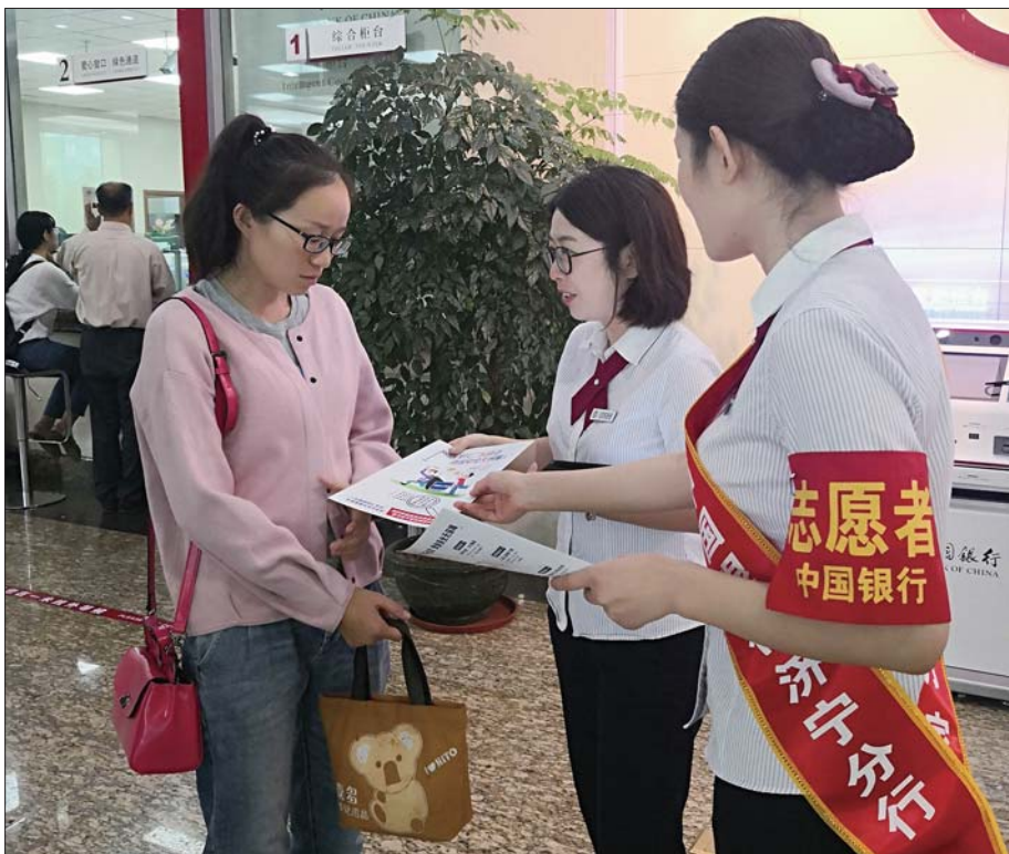
积极宣传个人外汇政策。

下一步,济宁中行将继续做好宣传活动,并通过此次活动,引导外汇市场主体依法合规办理外汇业务,普及个人用汇常识,引导个人依法合规用汇,增强自我保护意识,自觉抵制高收益诱惑,共建济宁健康稳定的金融环境。