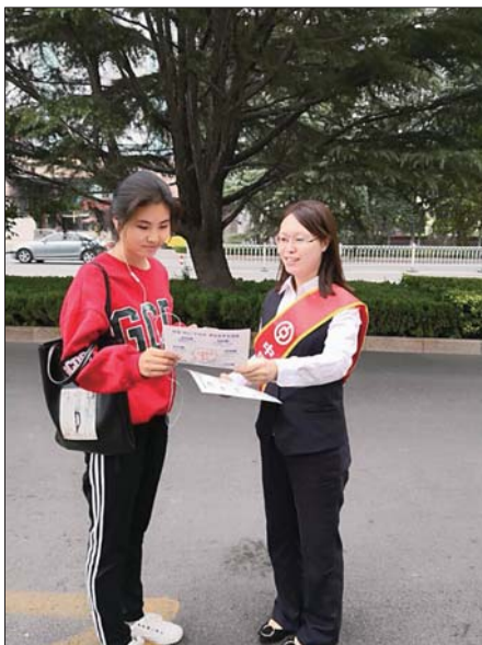
开展户外宣传活动。