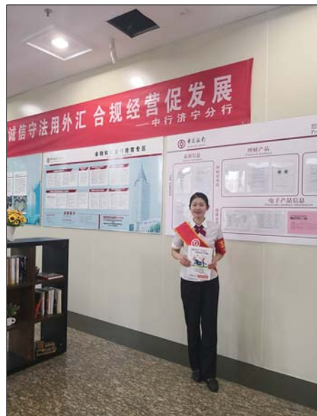
营业网点设置宣传专区。