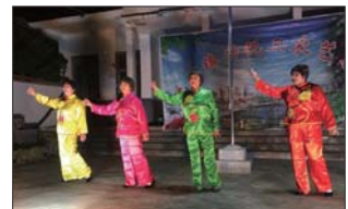
喜庆农业丰收 为庆祝第一个农民丰收节,丰富村民的业余文化生活,近日,沂源县悦庄成教中心校开展了推广农村中老年健身广场舞活动。(徐凤生)