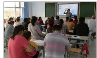
网络安全教育 近日,沂源县悦庄镇青龙山小学召开了一次家校网络安全教育家长座谈会,就网络的使用和管理问题与家长展开座谈。(张茂兰)