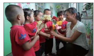
幸福教师节 为发扬尊师重教的优良传统,在教师节期间,沂源县悦庄镇中心幼儿园开展了“幸福教师节,师幼同欢乐”专题活动。(王明花 任东娟)