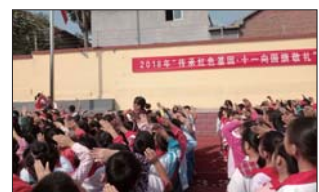
传承红色基因 为推进“扣好人生第一粒扣子”教育实践活动,近日,沂源县鲁山路小学开展了“传承红色基因·十一向国旗敬礼”系列活动。(李春霞)