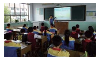
抵制秸秆焚烧 为保护环境,近日,沂源县悦庄镇埠村希望小学各中队纷纷开展“小手拉大手,抵制秸秆焚烧”主题队会活动。(崔君玉)