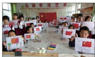
向国旗敬礼活动 为迎接国庆节,近日,沂源县鲁村镇徐家庄中心学校开展了“迎国庆、知国旗、向国旗敬礼”活动,献上对祖国母亲美好的祝愿。(孙晓)

近期,花沟镇中心小学积极开展唱红歌迎国庆活动。利用大课间组织学生开展“唱红歌迎国庆”活动。一周来每逢大课间,同学们激情高昂的歌声在教学楼内回荡。旨在,进一步激发学生的爱党爱国情感。(周成明)