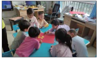
爱国教育活动 近日,沂源县燕崖镇中心幼儿园进行了升国旗、唱国歌、听老师讲爱国主义故事、给祖国妈妈过生日等系列爱国主义教育活动。(张霞)