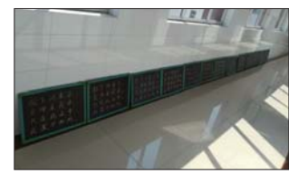
教师粉笔字比赛 为加强教师基本功训练,加强教师自身素质和综合教学水平提高,近日,沂源县张家坡中心学校举行了教师粉笔字比赛。(王均升)