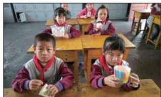
节俭环保迎国庆 近日,沂源县鲁村镇草埠中心完小组织学生开展了“节俭环保迎国庆”系列主题教育活动,迎接国庆节的到来。(刘特明)