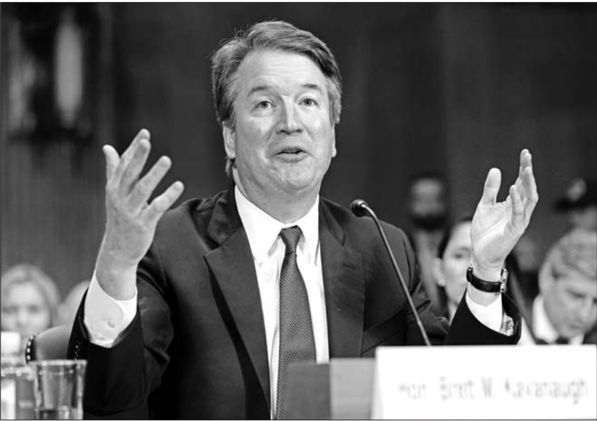
这是9月27日卡瓦诺在华盛顿出席听证会。

美国国会参议院当地时间6日表决通过总统特朗普对卡瓦诺出任联邦最高法院大法官的提名,卡瓦诺随后宣誓就职。当天,数百名反对这项任命的示威者在美国首都华盛顿国会山聚集,呼喊“11月快到了”,表示他们将在下个月的国会中期选举中以选票表达不满。