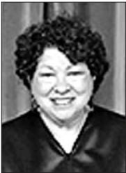
索尼娅·索托马约尔