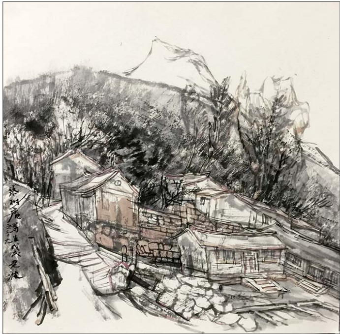
▲蔡树庵写生 50x50cm 韩敬伟

此次四人联展,既展示了他们的艺术探索成果,传递了他们的不同创作思想及艺术追求,同时也表现了清华美院绘画系倡导的以民族文化为依托,兼容并蓄、锐意进取的精神。(贾佳)