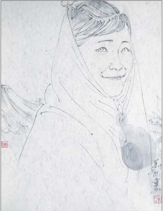
▲走近惠安女 41x32cm 刘临