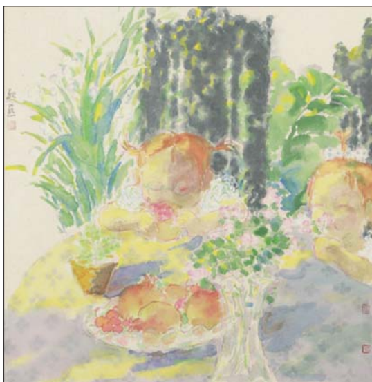
桌边女孩 68x68cm 韦红燕

汪港清的作品清新自然,气息淳朴,毫不造作,画中将自己的心境与自然空间很好地结合在一起,将画家对于自然生命深切的关爱投注到画面的形与色中,传达的则是自然造物的生命灵性。汪港清一手纵横传统,一手深入生活,观察时代,完善笔墨,他从学院深