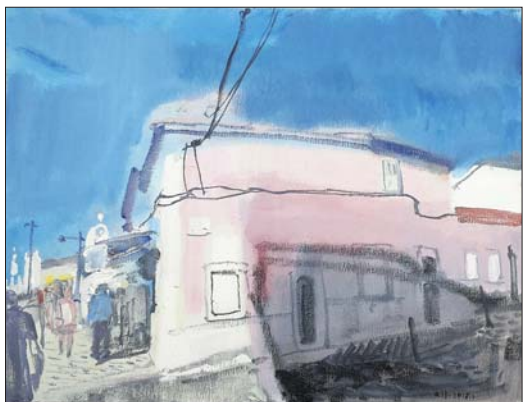
葡萄牙印象 陈天强

三位艺术家的作品每一笔都直抒胸臆,每一笔都酣畅淋漓,每一笔都言之有物!他们用或强烈夺目,或淡然有趣,或敏锐果断的不同风格面貌,呈现出了自然光下的万物之美!