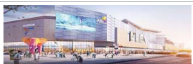
一座天街繁华一座城①