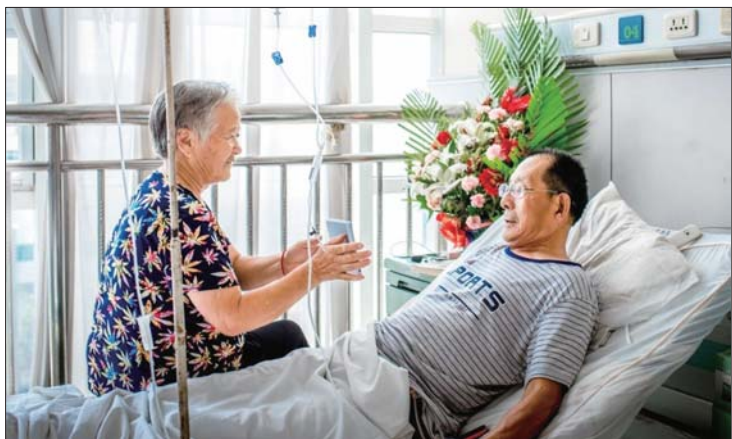
摄影地点:市人民医院 摄影时间:2018.7.28