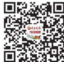
齐鲁晚报官方微信二维码

紧迫性。坚持“管行业必须管安全、管业务必须管安全、管生产经营必须管安全”原则;按照“全覆盖、无盲区”要求,开展调查摸底;对非法违法行为坚持露头就打,保持“打非治违”高压态势;推进50家生产经营单位双重预防体系建设力度;对事故隐患严重的生产经营单位,依法立即采取强制措施,铁腕整治,防止生产安全事故发生。