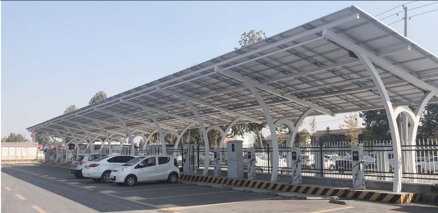
◀济南经十西路一处新能源汽车充电站,十余个充电桩利用寥寥。