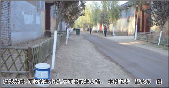
垃圾分类,可沤的进小桶,不可沤的进大桶。

统一配备,而这些小垃圾桶则由村里统一采购,一只5元钱,为包装涂料或油漆等使用后废弃物,免费向农户提供,村里花费400余元。