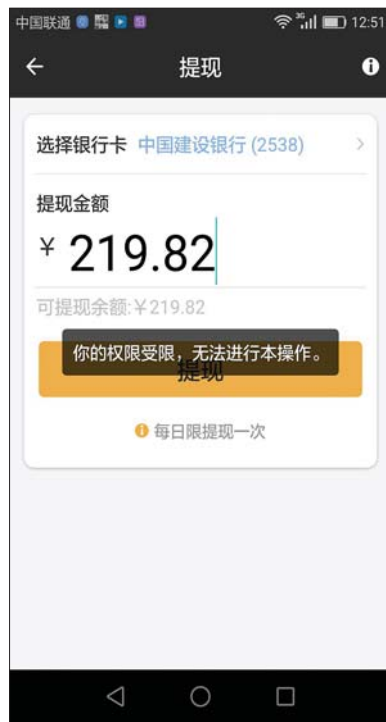
的哥账号被打车平台封禁。