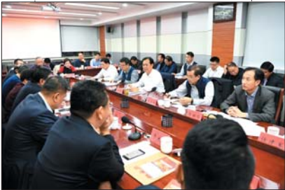
17日,市中区召开民营企业家座谈会。

伴随着出台优惠政策、加强培育选树、加大资金投入等一系列措施的实施,市中区进一步激发人才创新创业活力,全力打造“金牌环境”,为广大民营企业家送上“定心丸”,更为新时代市中区民营经济发展吹响“进军号”。