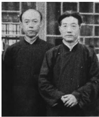
1950年代李苦禅和徐悲鸿院长