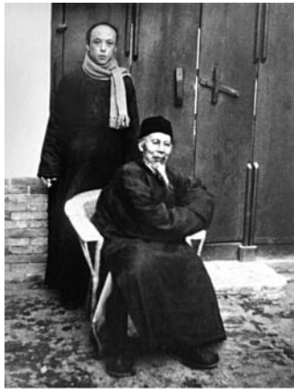
1926年李苦禅与恩师齐白石大师