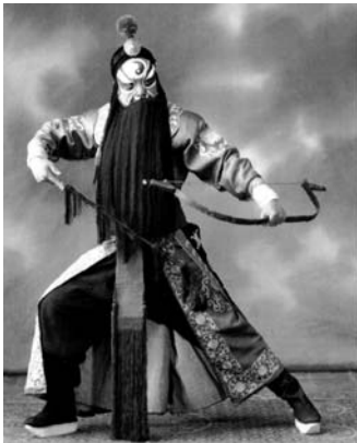
1930年代李苦禅扮《铁笼山》之姜维

主办单位:中国国家博物馆、中共山东省委宣传部、中国美术家协会、中央美术学院、山东省文学艺术界联合会 协办单位:山东省美术家协会、中国美术馆、北京画院、李苦禅纪念馆 展览时间:2018年11月21日——12月22日 展览地点:中国国家博物馆(南7、南8展厅)