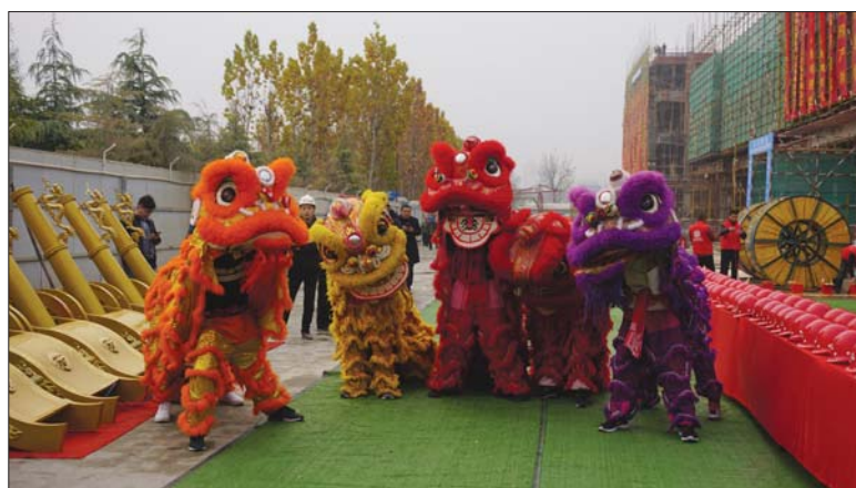
舞狮助兴封顶现场。