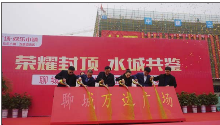
与会嘉宾浇灌金沙,聊城万达广场项目主体结构正式封顶。