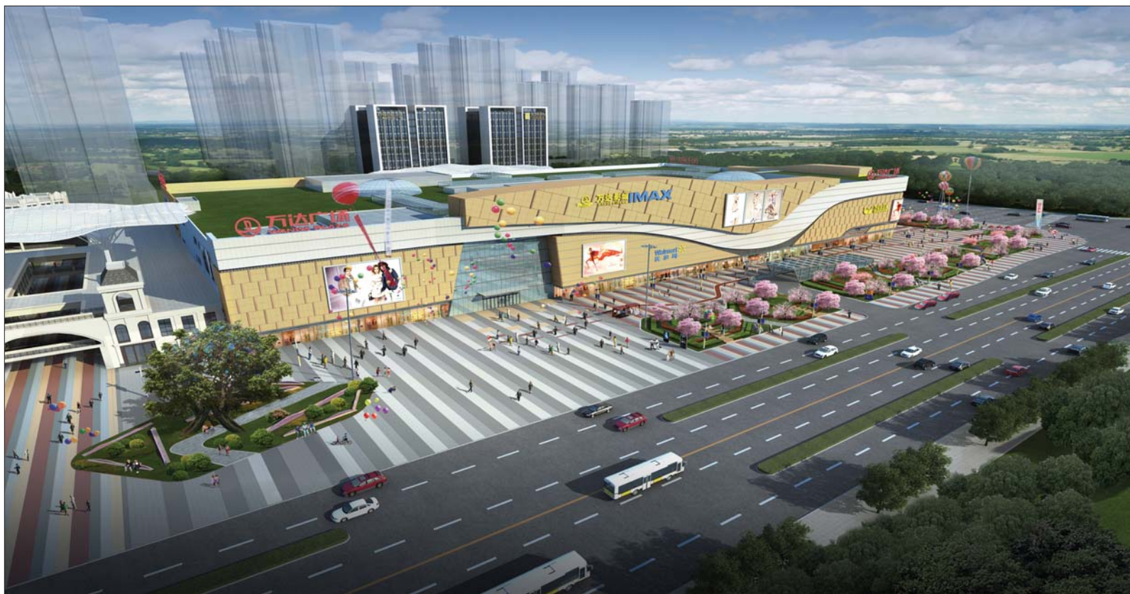
聊城万达广场效果图。