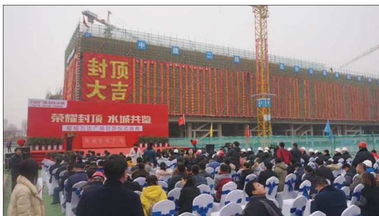
封顶现场座无虚席。