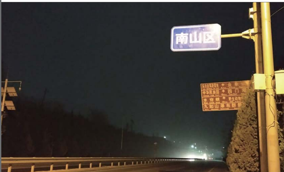
“南山区”牌子成了103省道夜间明暗的分界线。

不到一年半的时间,12345受理813条关于南部山区路灯的投诉。南部山区路灯为何出现“灯下黑”?连日来,记者对多个相关部门进行了深入采访,随着南部山区路灯整体状况的逐步清晰,一串串数字令人焦虑,这一区域的“灯下黑”问题亟待解决。