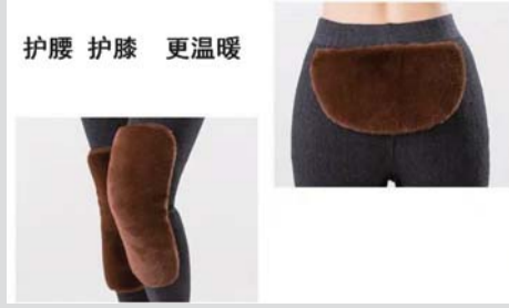
护腰 护膝 更温暖