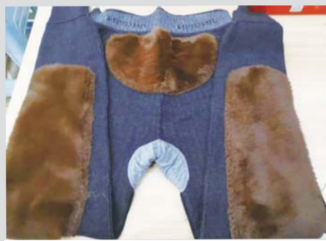
细节篇 精工细作 彰显品质