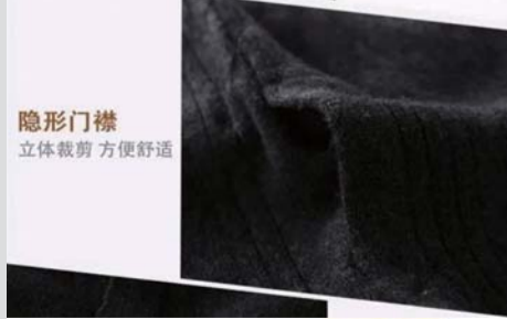
隐形门襟 立体裁剪 方便舒适