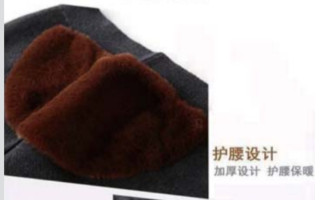
护腰设计 加厚设计 护腰保暖