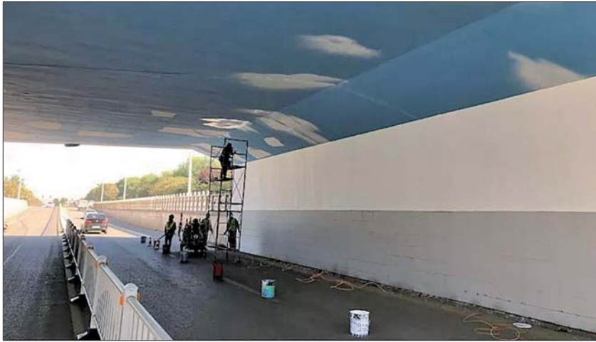
▲清照大街铁路桥涵美化亮化工程。

“今后我们会按照党委的要求,全面加强党的建设,不断提高作风效能,打造一支勇于担当作为、廉洁高效、干事创业的干部职工队伍,在城市发展建设中当先锋、做表率。”章丘市政设施管理所相关负责人表示。