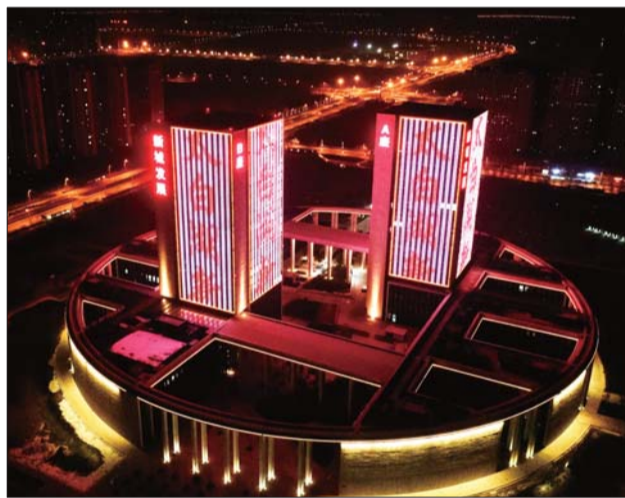
夜晚璀璨夺目的新城发展大厦。

济宁“光耀新城”项目轮廓范围大致在洸河以西、石佛路以北、日荷铁路以南、京杭大运河以东,总面积约37平方公里。亮化分为生态景观和建筑照明两大区域。其中,生态景观区主要有公共空间、绿地广场、河湖湿地等;建筑照明区分为行政中心、文体中心、住宅区及桥体。以行政、文化中心区为核心,北部的两处居住区为基础,西侧的教育区为补充,中间的运河文化旅游区为亮点,最终形成一个功能完整的济宁南