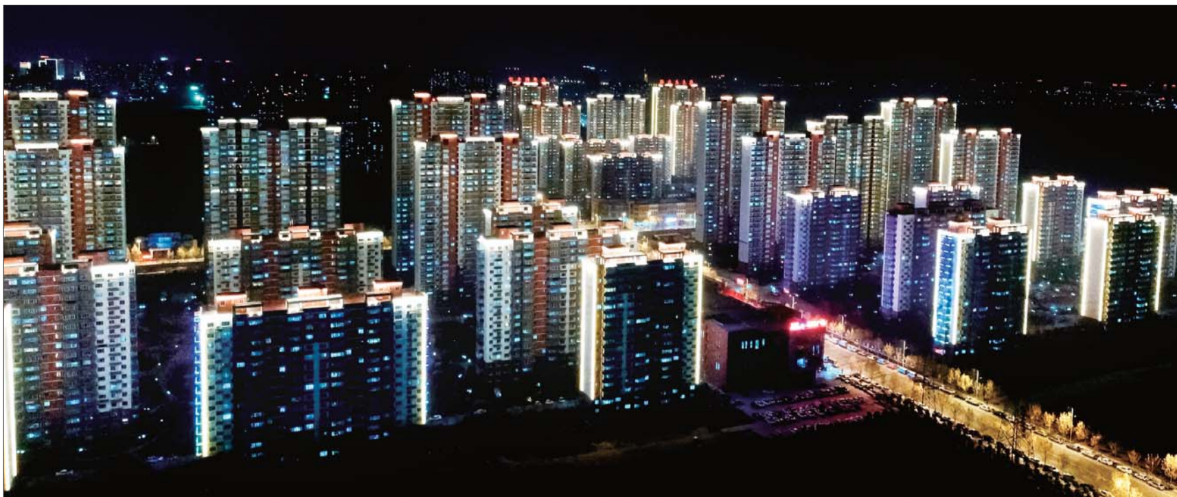
闪亮夺目的京杭佳苑。