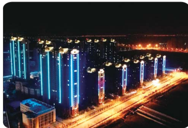
流光溢彩的水运雅居。