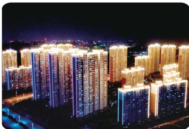
美轮美奂的颂运水庭。