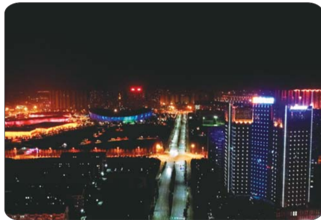
夜幕下的凯莱酒店。