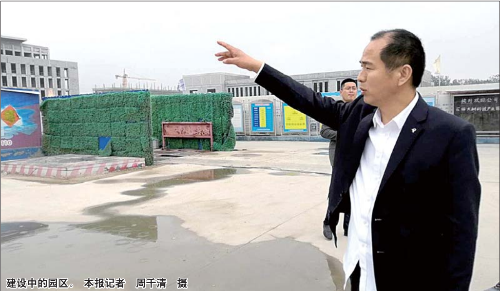
建设中的园区。

2016年是大树公司历史性的一年。在上海食品配料展会,该公司聘请国家“千人计划”专