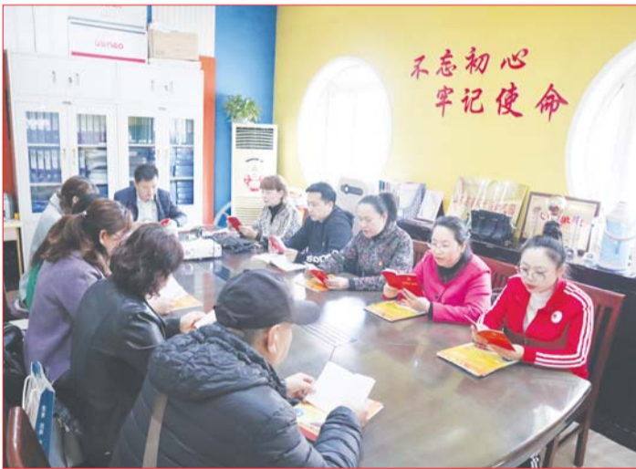
主题党日诵读党章

集团化办学是促进教育均衡发展,办人民满意教育的重要举措之一。济南市历城区钢城幼教集团自2018年成立以来,始终不忘初心,紧紧围绕办人民满意的教育为中心任务,真抓实干、担当落实,创建了“用心养育,爱暖钢城”的党建特色品牌,不断满足片区居民的入园需求,并引领着集团各所幼儿园走出了一条属于自己的教育之路。