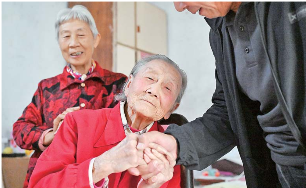
听文化站宣传员唱完《母亲》后,老人激动得眼圈湿润。