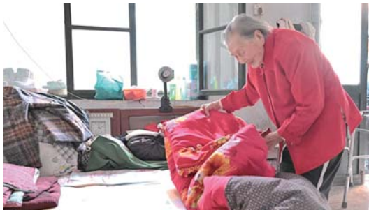
老人起床后第一件事就是叠被。