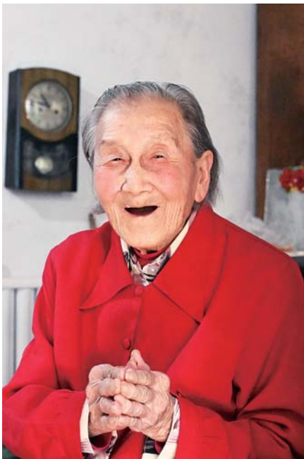
老人送别记者时一再叮嘱再来。