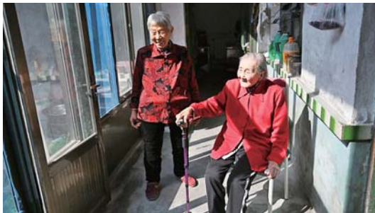
老人腿骨折后就不出门了,天好就在门廊里晒太阳。