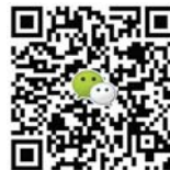
扫码加微信投稿 期待您的精彩佳作