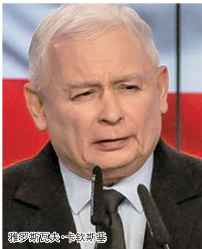
雅罗斯瓦夫·卡钦斯基