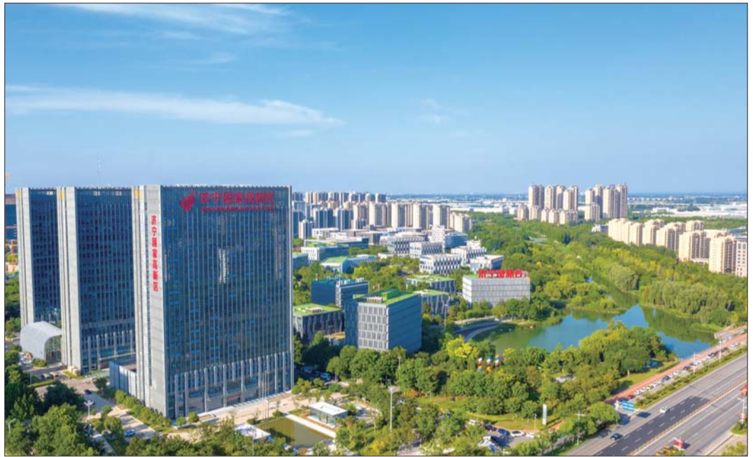
高新区持续深化体制机制改革力。

聚焦高新区重点产业,园区布局由原来的一区十二园调整为一区十园。“我们按照‘产业链+专业园’集群培育理念,对产业趋同程度高的园区进行整合