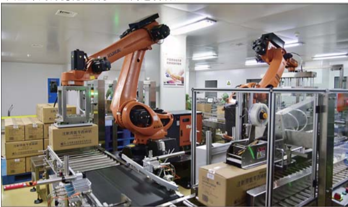
企业车间机械化生产现场。