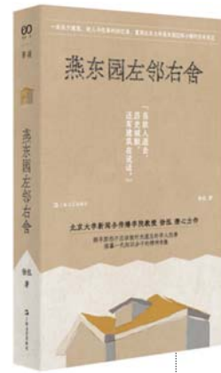
《燕东园左邻右舍》 徐泓 著 单读·上海文艺出版社