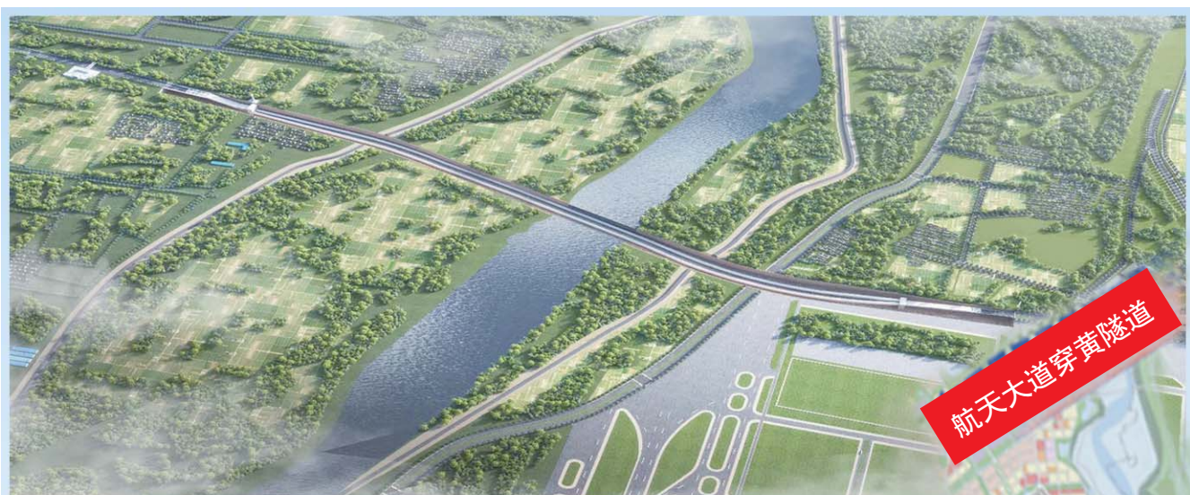
航天大道穿黄隧道