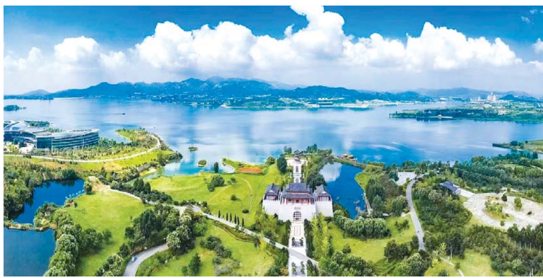
莱芜区叫响“鲁中山水大观园、文化生态休闲区”品牌。

2024年,莱芜区将主动服务和融入新发展格局,锚定“走在前、开新局”,把“高质量发展”作为首要任务,紧扣“黄河流域先进制造业中心、省会城市副中心”发展定位,坚定实施“生态立区、工业强区、创新兴区”三大战略,大力开展“产业集聚、项目深化、改革创新、有效需求、城市更新、乡村振兴、生态优化、民生改善”八大提升行动,强化“党建引领、治理高效、作风建设”三项保障,聚势突破,实干争先,奋力推进现代化新莱芜建设再上新台阶。