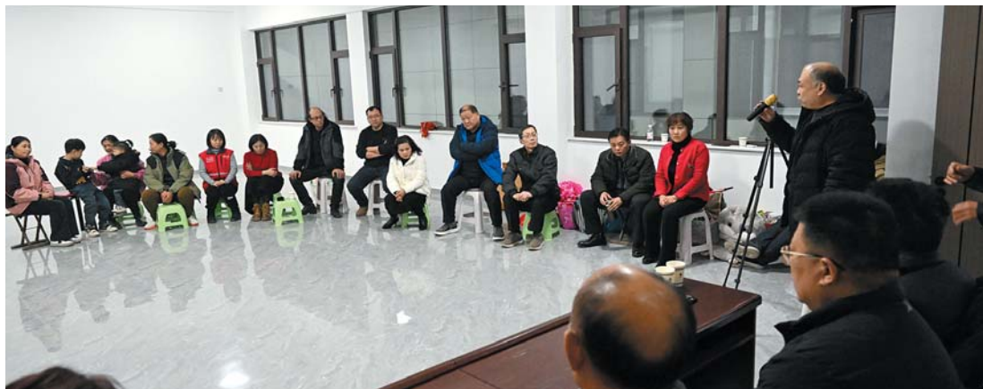
「村晚」的演员很多都是四里八乡的乡亲。