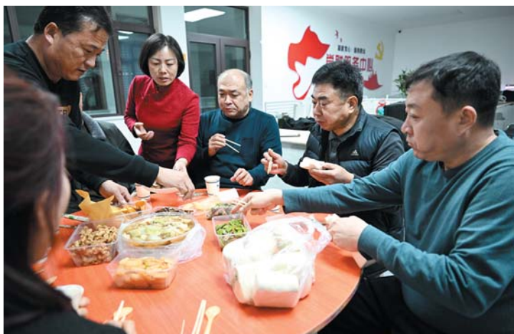
艺术团活动期间，「村晚」导演和演员一起吃大锅菜啃馒头。