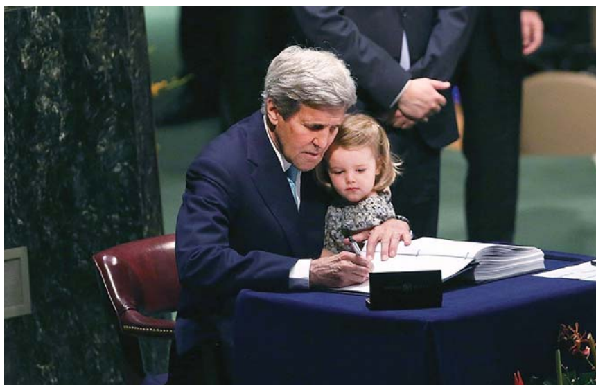
2016年，克里怀抱孙女代表美国签署《巴黎协定》，以示“为下一代努力”的决心。（资料片）

有报道称，克里认为，拜登能否连任是国际气候事业“最重要的变数”，而他可以凭借在气候问题领域的丰富经历和成绩，为拜登争取更多选票，尤其是年轻选民群体。