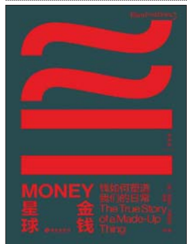
《金钱星球:钱如何塑造我们的日常》 [美]雅各布·戈德斯坦 著 李昊 译 理想国 | 海南出版社