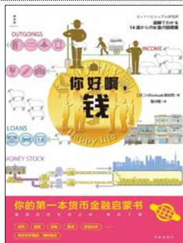
《你好啊,钱:你的第一本货币金融启蒙书》 [日]Infovisual研究所 著 鲁兴刚 译 理想国 | 上海出版社