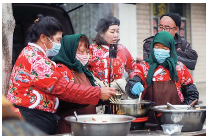
大河炸肉蛋