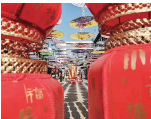
大观园年味浓