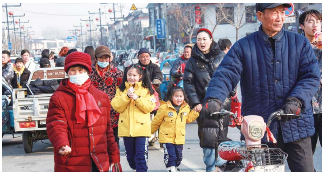
跟妈妈回乡赶年集