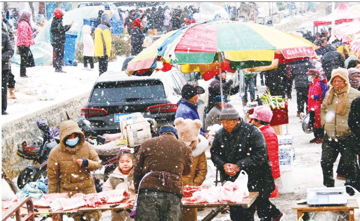
雪中年集人气高