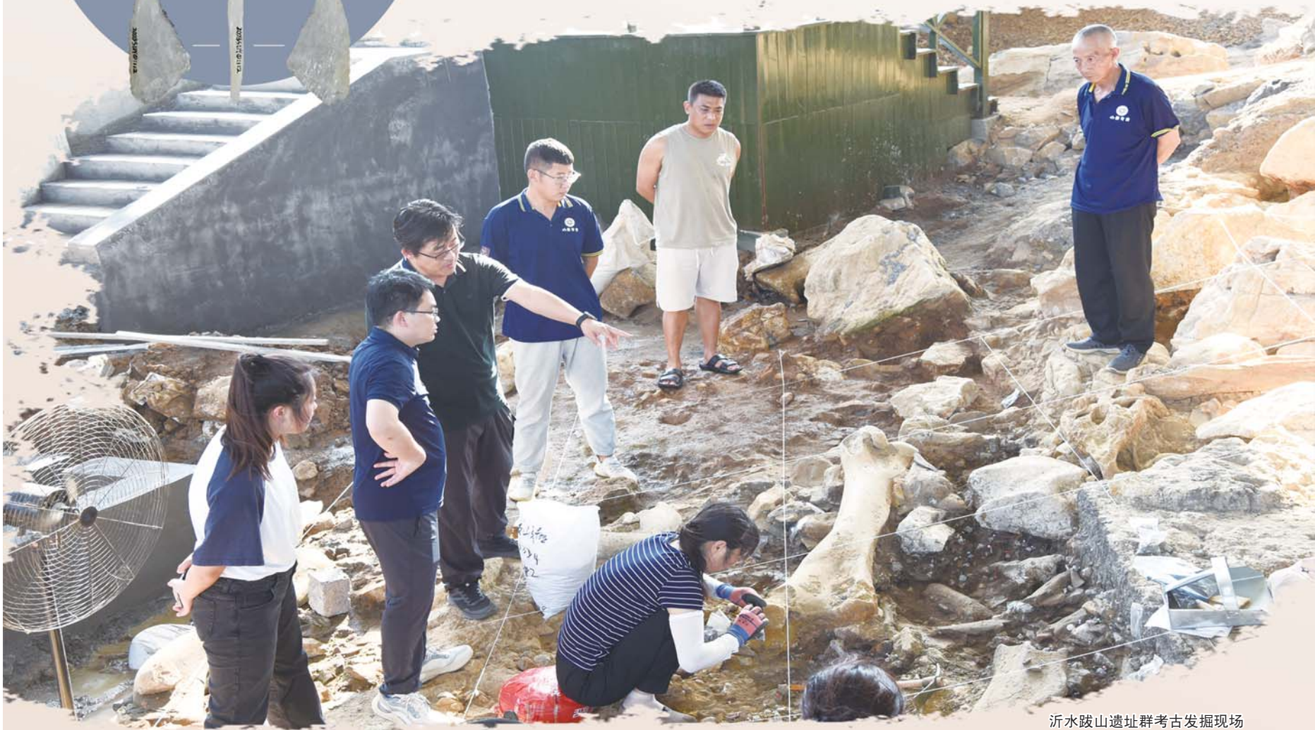
沂水跋山遗址群考古发掘现场

随着跋山遗址群的发掘,海岱地区十万年来的历史脉络得以清晰再现,而且直接否认了末次冰期寒冷期东亚古人类灭绝的推论,清楚展示出山东地区乃至东亚早期人类与文化持续演化发展的路径。